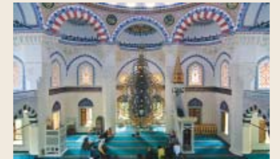
Die Şehitlik-Moschee in Berlin-Neukölln

12:10 Şehitlik-Moschee (12.10 - 16.10 Uhr) Columbiadamm 128, 10965 Berlin-Neukölln (U6 Platz der Luftbrücke, U8 Boddinstr., Bus 104) Mittagsgebet Interessierte haben die Möglichkeit, zuzuschauen.